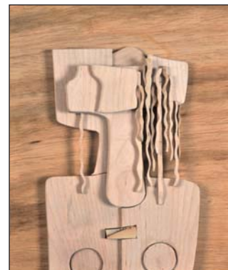
Série Personnage 2