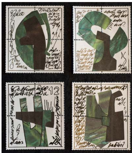
Série Timbres et sculptures

à l'Académie des beaux-arts de Pérouse, je ne connaissais rien. J'ai été confronté aux arts étrusque et romain et à la Renaissance, et je suis passé sans plus de façon au Pop Art grâce à une exposition qui se tenait à Venise.