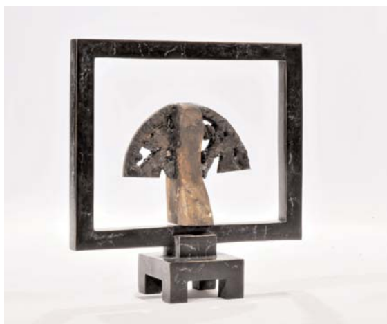
Tête de Ménine avec cadre