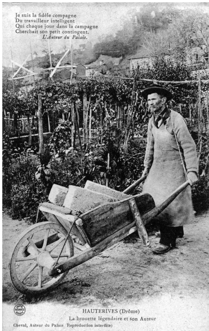
Le Facteur et sa Brouette, carte postale