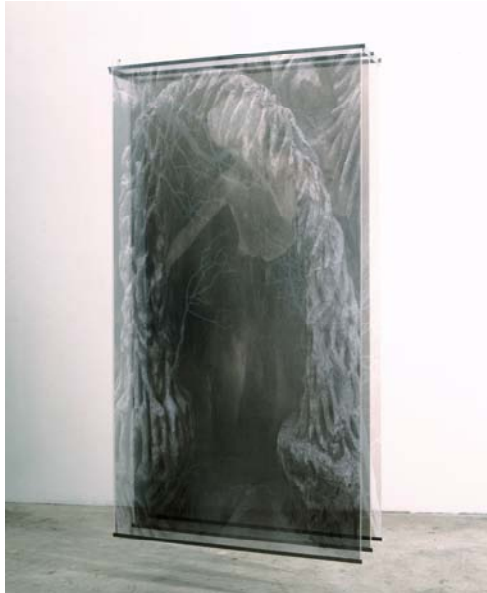
Gabriela Morawetz, Passages , jet d'encre pigmenté sur voile, 185X107X30 cm, 2006 Collection de l'artiste