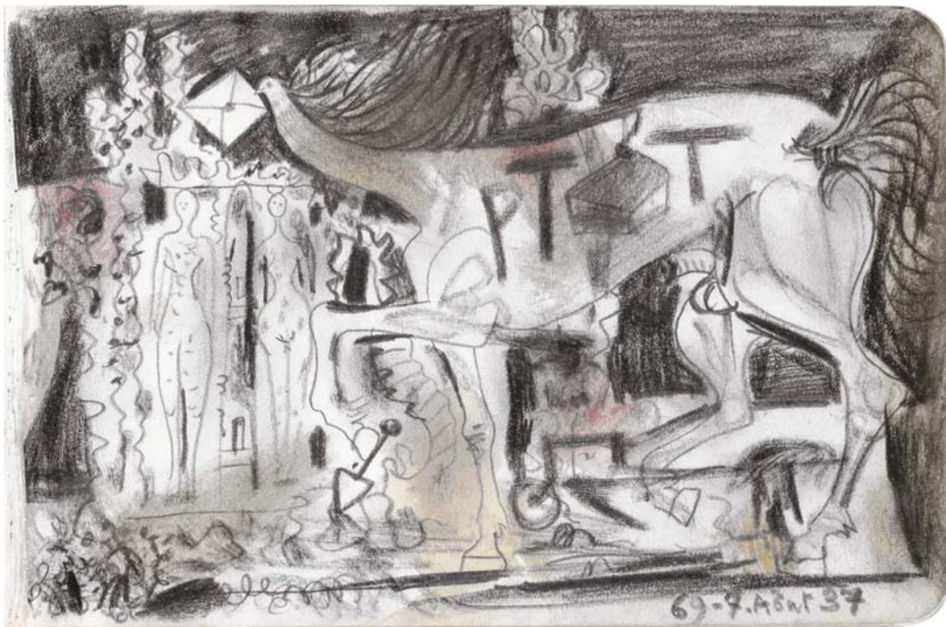
Picasso, Le Facteur Cheval , 69- 7 août 37, dessin au crayon noir, Collection privée, Courtesy BFAS Blondeau Fine Arts Service, Genève © Adagp