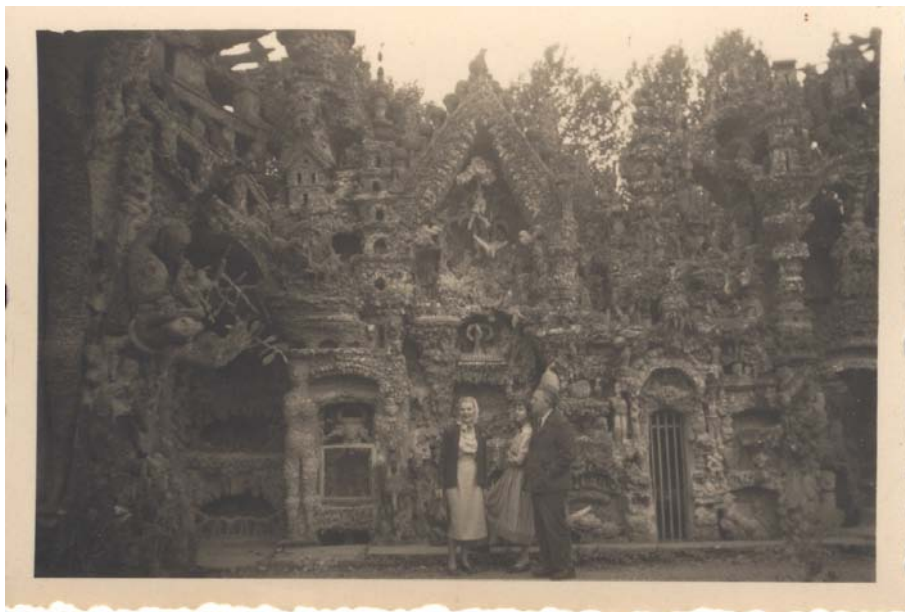
André et Elisa Breton au Palais Idéal, non datée, photographie provenant du fonds Valentine Hugo