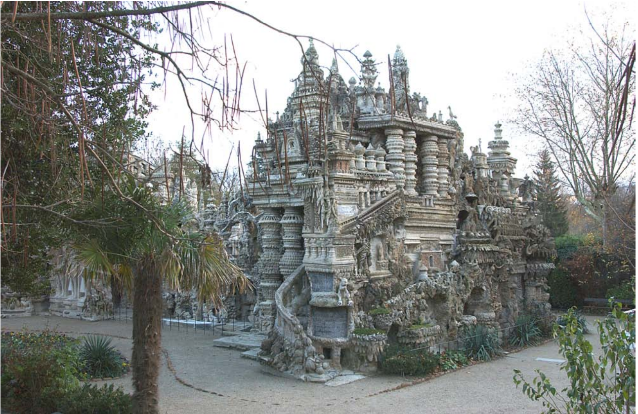
Michel Fischer, Le Palais Idéal , 2006