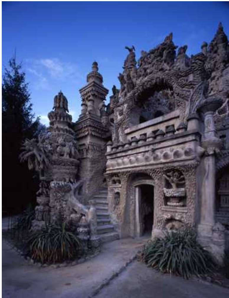
Hidehiko Nagaishi, Le Palais Idéal , photographie, 2006 © Hidehiko Nagaishi